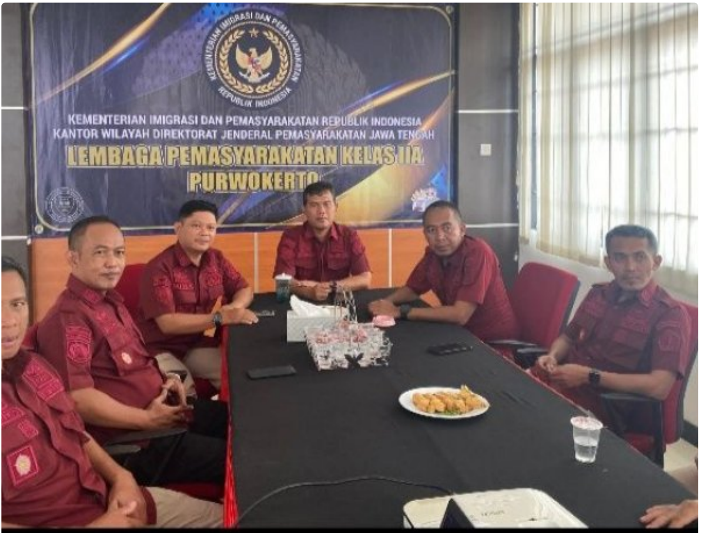
Lapas Purwokerto Ikuti Penguatan Kehumasan terkait Etika Penggunaan Media Sosial

PURWOKERTO Lembaga Pemasyarakatan (Lapas) Kelas IIA Purwokerto Mengikuti Secara Virtual Penguatan Kehumasan terkait Etika Penggunaan Media