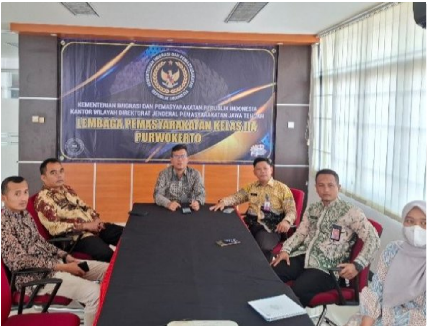
Lapas Kelas IIA Purwokerto Ikuti Entry Meeting Pemeriksaan BPK RI Atas Laporan Keuangan Kementerian Hukum dan HAM Tahun 2024 secara Virtual

PURWOKERTO - Lembaga Pemasyarakatan (Lapas) Kelas IIA Purwokerto mengikuti Entry Meeting Pemeriksaan atas Laporan Keuangan Kementerian