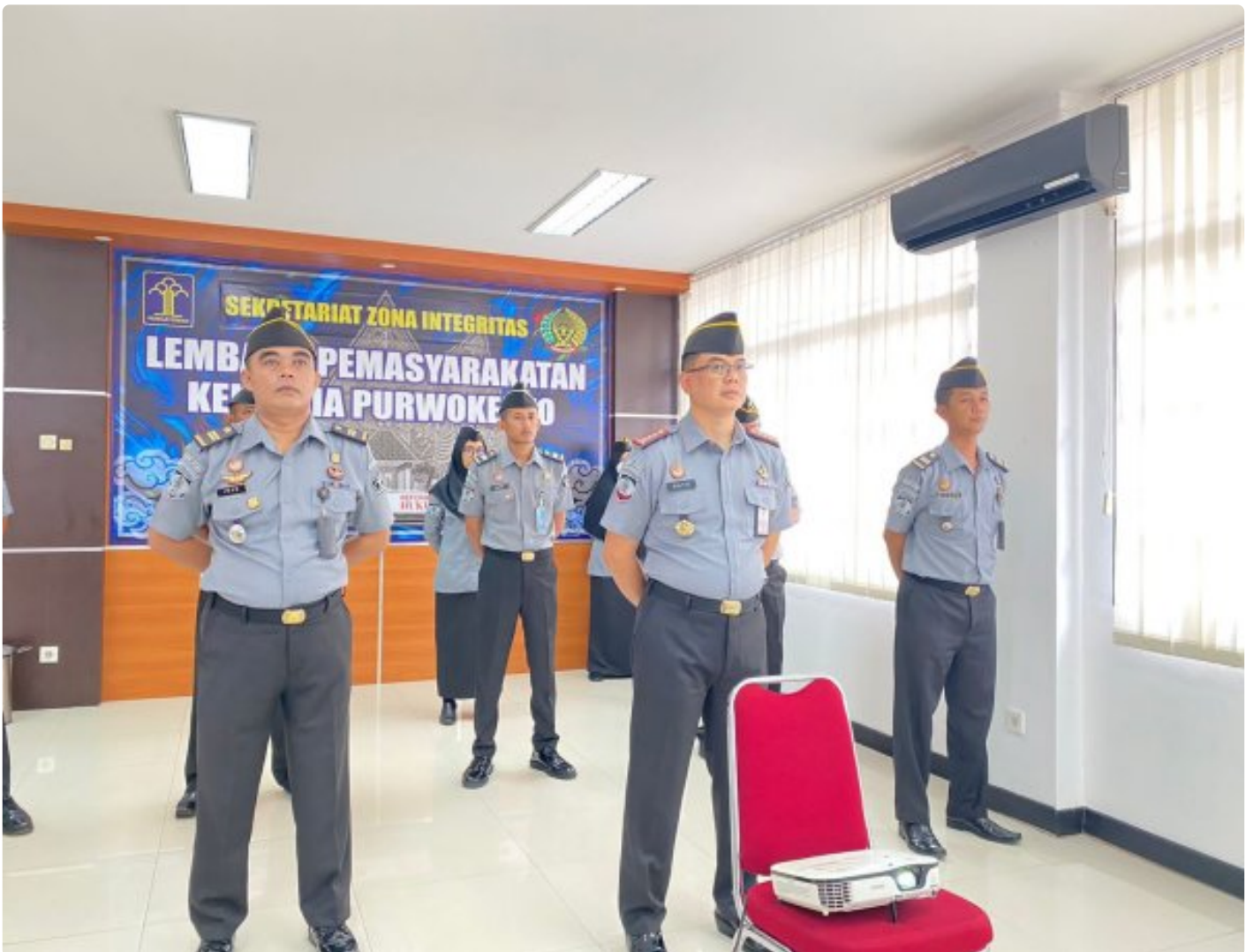
Lapas Purwokerto Ikuti Apel Kesiapan Pengamanan Hari Raya Idul Fitri 1445 H / 2024 M

PURWOKERTO Lembaga Pemasyarakatan Kelas IIA Purwokerto mengikuti Apel Kesiapan Pengamanan Hari Raya Idul Fitri 1445 H / 2024 M di Aula Rupa